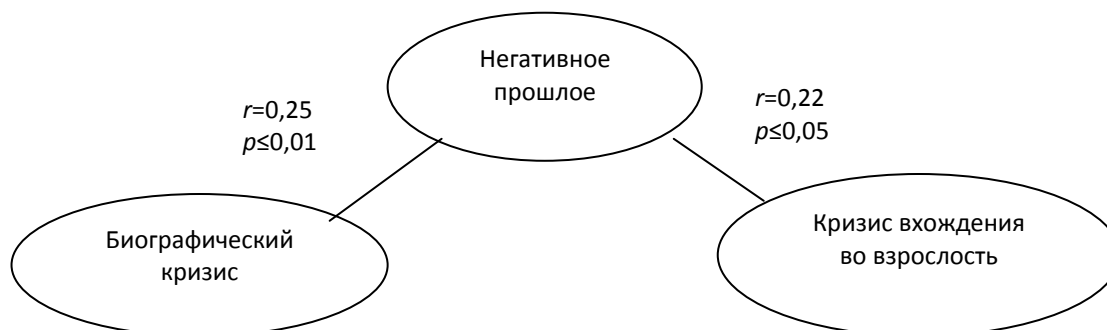
Рис. 2. Структура взаимосвязей причин кризисов и временной транспективы при «низкой» интенсивности переживаний ( n=113 ).

1. Независимо от причины кризиса переживания и особенности направленности и «модальности» транспективы имеют выраженную специфику. В кризисе, вызванном любой причиной, одинаковым образом проявляется динамика переживаний: усиливается к апогею, потом снова уменьшается. Характерным признаком кризиса выступает разотождественность образа «Я» (разрыв временной транспективы). Направленность временной транспективы (представления о себе в прошлом, настоящем и будущем) и модальность (положительное – отрицательное) одинаково проявляются вне зависимости от причин кризиса.