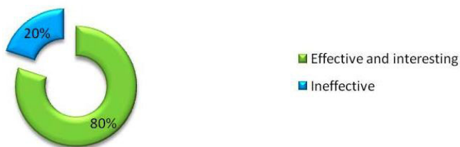
Figure 3- Effective and ineffective exercises

There can be no doubt, the great teacher is a person who can motivate their students, create a friendly atmosphere and organize the class. Before they motivate others they should motivate themselves. The technique which is used on the lesson should not be the same as previous was. The conversation techniques are used on every lesson. When the students cross the threshold of the classroom they greeting a teacher, discuss the previous day, the weather or share impressions of different events. The great teacher is a person who can motivate their students, create a friendly atmosphere and organize the class. Before they motivate others they should motivate themselves. The technique which is used on the lesson should not be the same as previous was.