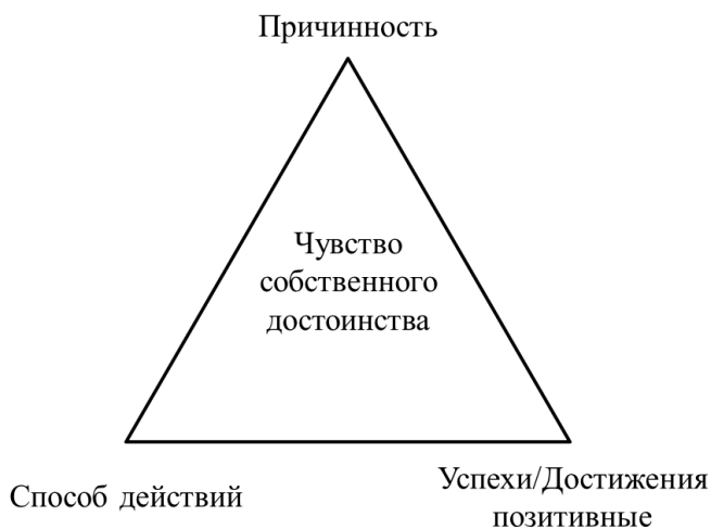
Рис. 1. Концептуальная основа самоисправления

Основу вышеназванных зависимостей можно представить в виде треугольника (рис. 1).