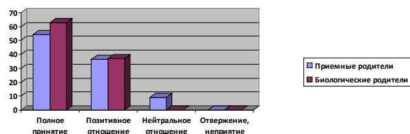
Рис. 1. Типы эмоционального отношения приемных и биологических матерей к родным детям.

Сравнительный анализ эмоционального отношения приемных и биологических матерей к родным детям представлен на рисунке 1.