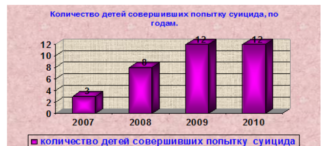
Рис.1. Количество детей совершивших попытку суицида

Е.В. Хохлова [3] отмечает, что лишь в 10% у подростков имеется истинное желание покончить с собой (покушение на самоубийство), в 90 % суицидальное поведение подростка – это «крик о помощи». Неслучайно 80% попыток совершается дома, притом в дневное время или вечернее время, т.е крик этот адресован ближним прежде всего. Результаты исследования представлены на рисунке 1.