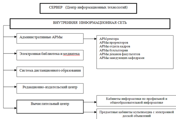
Рисунок 2 - Инфраструктура информационной среды образовательного учреждения

Центральным звеном инфраструктуры информационной среды образовательного учреждения (рис.2) является телекоммуникационный узел, состоящий из сервера и внутренней информационной сети. На базе телекоммуникационного узла организуется накопление, систематизация и анализ информационных ресурсов каждого из четырех указанных модулей, т.е. формируется автоматизированный реестр созданных электронных административно-управленческих и учебных материалов, хранящихся на сервере. Пользователи внутренней информационной сети обеспечиваются доступом к информационным ресурсам сервера, компьютерных классов информатики, предметных кабинетов мультимедиа, оснащенных электронными досками, административных АРМов, библиотечной автоматизированной информационной системы и издательско-полиграфической системы.