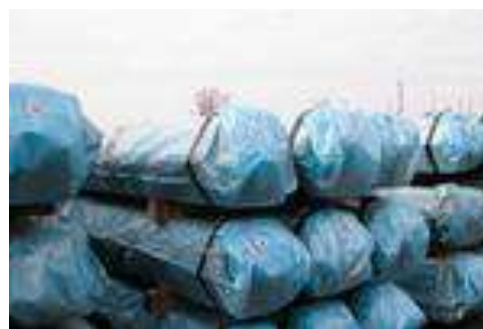
Рис. 1. Упаковка из полипропиленовой ткани для металлопродукции: а – транспортные мешки; б – пологи