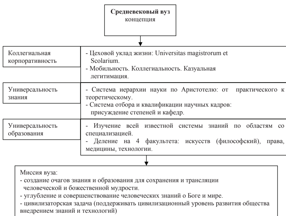
Рис. 1. Концепция деятельности средневекового высшего учебного заведения [11, с. 75].

Безусловно, несколько упрощая и игнорируя ряд дополнительных обстоятельств, данные схемы помогают визуализировать представление о том, как собственно становятся возможны процессы трансформации применительно к концепции высшего учебного заведения. Однако это не единственный этап первичной рефлексии над проблемой перед началом процесса разработки основных требований к управлению современным вузом. Другим важнейшим этапом являются сопоставление концепций вуза с определенными моделями деятельности, изучение управленческой составляющей в них.