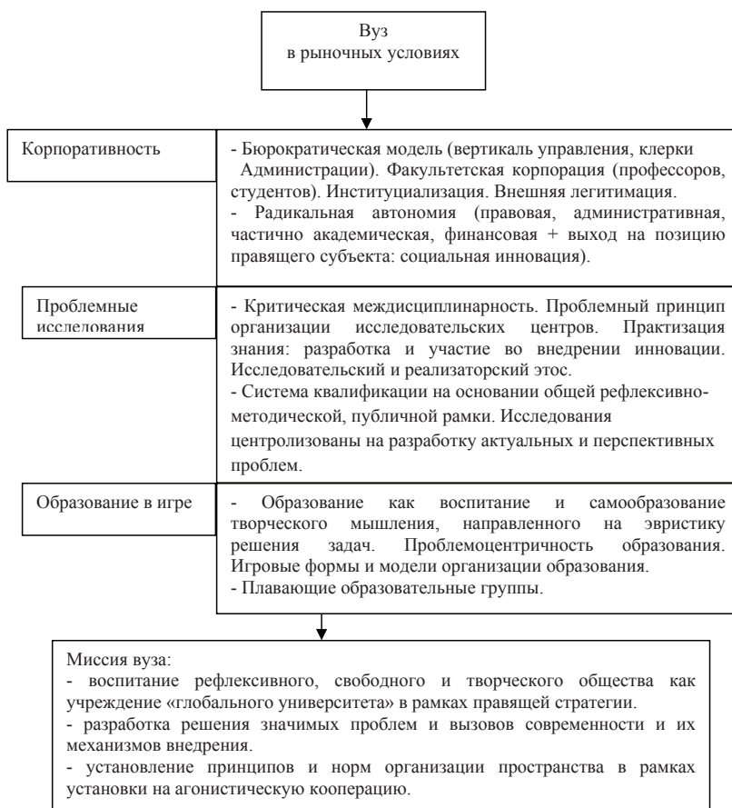
Рис. 3. Концепция деятельности высшего учебного заведения в рыночных условиях [11, с. 77].

Рассмотрим американскую модель вуза в таблице 1.