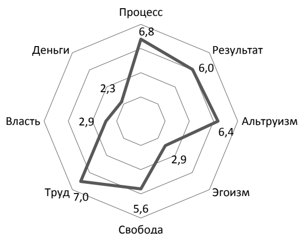
Рис. 2. Средние значения по показателям социально-психологических установок у студентов-волонтеров ( n=27 )

При проведении корреляционного анализа нами была получена обратная корреляция по шкале безличной каузальной ориентации с установками на результат ( r=-0,42 при p \leq 0,05 , критерий Спирмена) и свободу ( r=-0,73 при p \leq 0,01 , критерий Спирмена), мотивацией на достижение успеха ( r=-0,42 при p \leq 0,05 , критерий Спирмена).