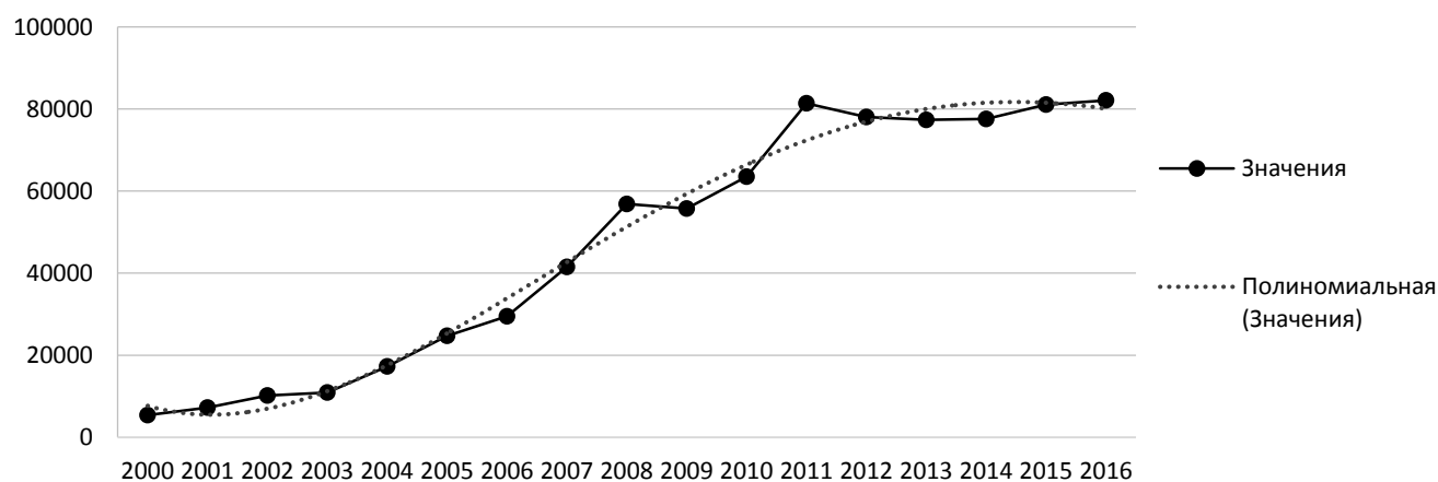
Рис. 2. Динамика доходов консолидированного бюджета Белгородской области за 2000–2016 гг., млн руб.

Используя уравнения трендов определены прогнозные значения факторов модели и ВРП на душу населения на последующие два года (табл. 4).